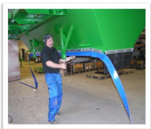
Enkelt att montera. Finns i längden upp till hundra meter per rulle.