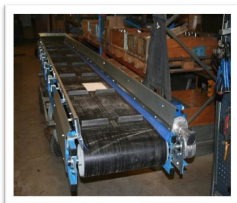
Låg friktion mot bandet. Spar energi! TPU mot gummi, en bra kombination